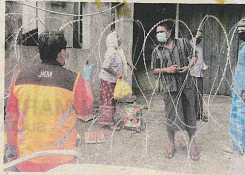
Petugas Jabatan Kebajikan Masyarakat (JKM) menyalurkan makanan kepada penduduk PKPD Selayang Baru, Gombak semalam.

"Fokus utama pelaksanaan PKPD di sebahagian kawasan Selayang Baru ini antara lain adalah untuk mengenal pasti kelompok warga asing yang per-