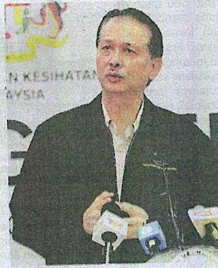
Dr Noor Hisham ketika sidang akhbar harian berkaitan jangkitan Covid-19 di Kementerian Kesihatan, Putrajaya semalam.

Dr Noor Hisham berkata, ia menjadikan bilangan keseluruhan kes di